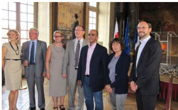
Ci-contre, dans l'ordre, le Consul de Pologne lors de son allocution de clôture ; photo réunissant les instigateurs français et polonais de ces «Journées polonaises». Page de droite, l'assemblée durant la cérémonie de clôture, salle des Illustres au Capitole.