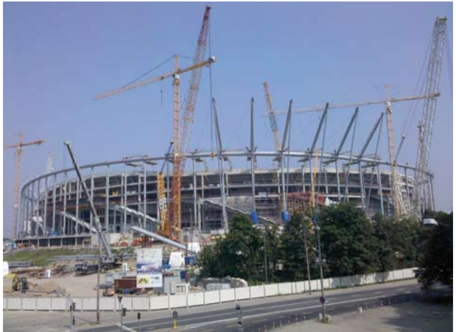
Construction du stade de Varsovie à l'occasion du futur Championnat d'Europe des nations de football qui aura lieu en juin 2012 en Pologne et en Ukraine

> Développement de Leroy Merlin en Pologne. Son premier magasin a été installé à Piaseczno près de Varsovie en 1996 avec une centaine de personnes. Aujourd'hui, Leroy Merlin a 40 magasins dans toute la Pologne et 7000 employés. C'est désormais une société polonaise d'origine française : 80% des produits vendus viennent de fournisseurs polonais et, au sein du groupe, seulement trois personnes sont des Français.