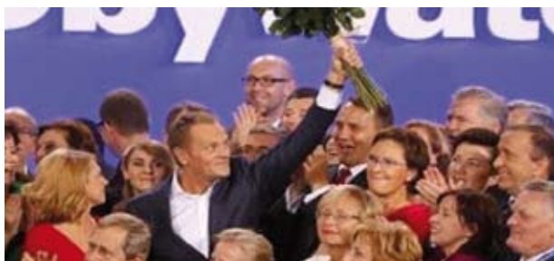
Donald Tusk a été reconduit chef du gouvernement polonais.

L es élections législatives du dimanche 9 octobre ont donné la victoire à la coalition des libéraux de la plate-forme civique (PO) du Premier ministre Donald Tusk (39,2 % des voix et 206 sièges) et du parti paysan (PSL) (8,4 % des voix et 28 sièges) cumulant ainsi 234 sièges