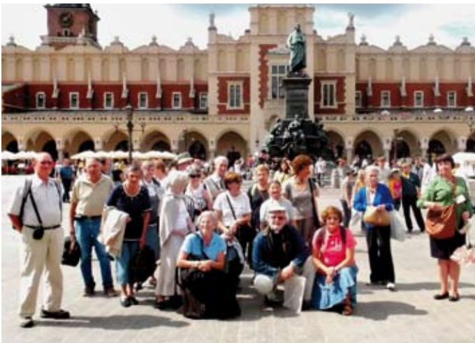
Le premier groupe de touristes d'Anna Events International à Cracovie.

L'agence Anna Events International spécialisée dans les voyages à destination des Pays de l'Est de l'Europe continue, depuis sa création, à promouvoir le tourisme en Pologne, en République Tchèque et aux Pays Baltes.