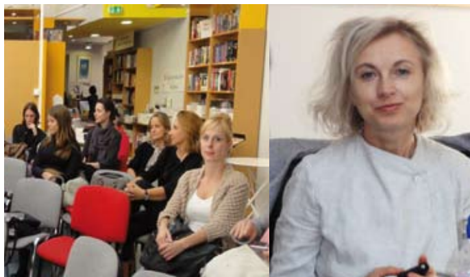
Rencontre avec Manuela Gretkowska

Le 20 octobre 2011, à la Librairie Ombres Blanches à Toulouse, une quarantaine de personnes est venue rencontrer Manuela Gretkowska.