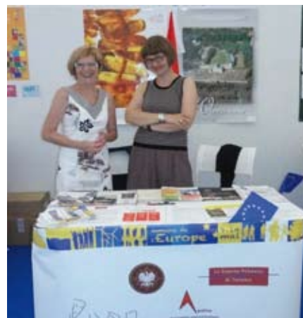
Stand de l'association lors du Forum des Langues (à gauche) et de la Semaine de l'Europe (à droite)

Janvier 1981, naissance officielle de l'association « Les Amis de la Pologne ». Officielle car avant cette date, dès 1980, quelques uns des membres fondateurs décident d'apporter un soutien moral et matériel aux polonais éprouvés par les tragiques événements internes dans leur pays et réussissent un premier envoi de 5 tonnes de lait et de médicaments.